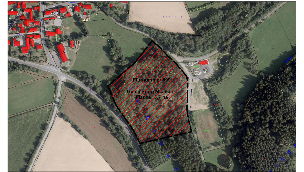
Ausgleichs- und Kompensationsfläche auf Fl. Nr. 599, Gem. Micheldorf Ehemaliger Steinbruch bei Micheldorf M 1/5000