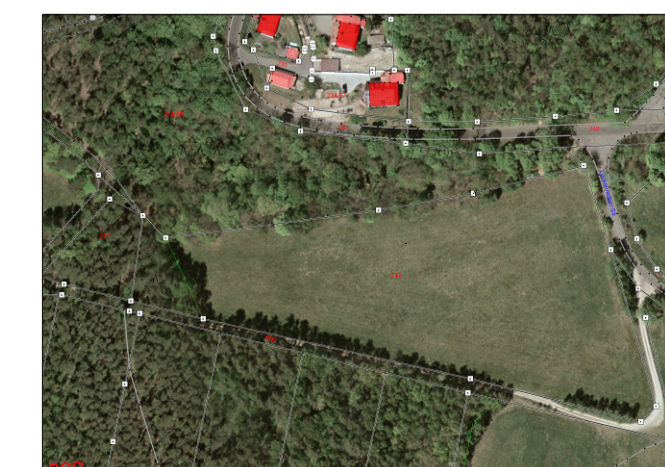
Orthofoto Fl.Nr. 243 Gemarkung Leuchtenberg