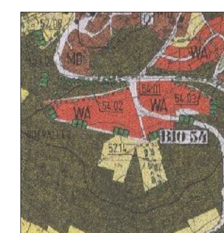
Auszug Flächennutzungsplan Leuchtenberg